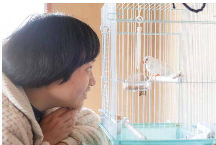
飼っている小鳥。名前は「おはぎ」