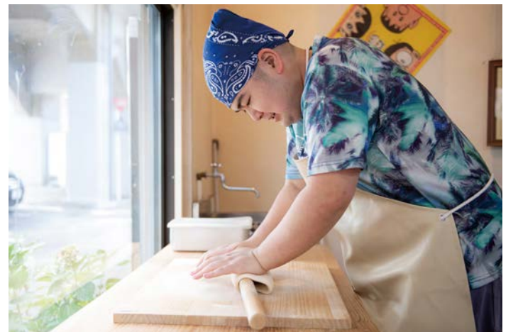
麺打ち職人に変身!