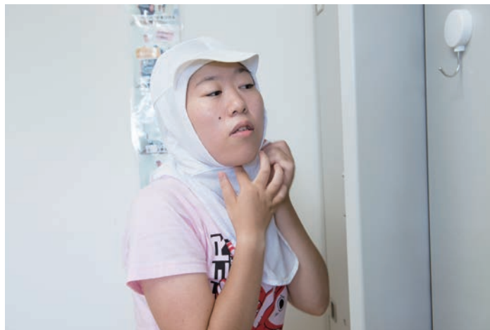
作業着に着がえて、お仕事開始！