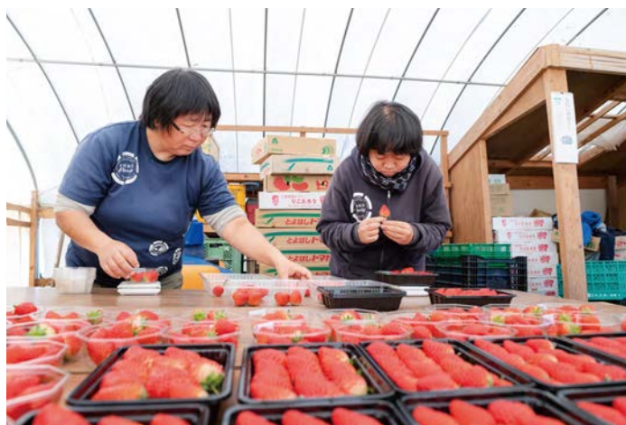
一粒ずつ、キズがないかチェック