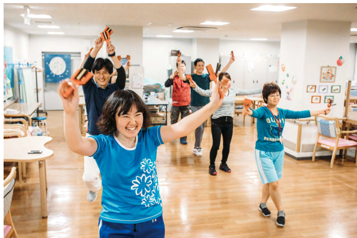
勤務先のよさこいグループにも参加