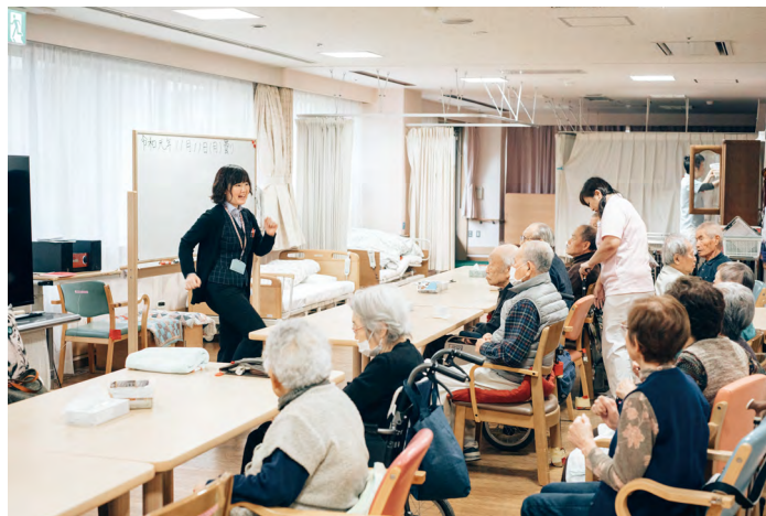
レクリエーションは、足踏みから