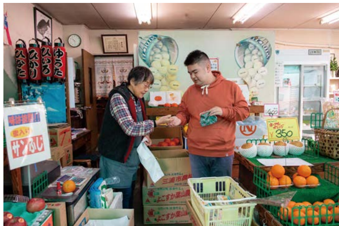
その日使う野菜を八百屋に買い出し