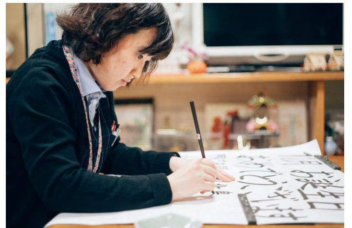
張り紙の文字を書く仕事も任されている