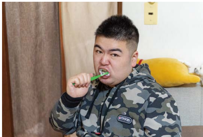
ゆっくり、ていねいに歯磨き