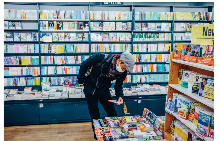
仕事 しごと 帰り本屋 ほんや さんに寄り道 よちみち