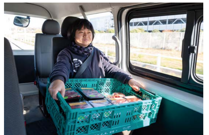
愛情たっぷりのいちごをスーパーに納品