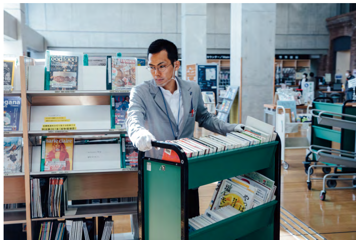
点検 てんけん がすんだ本 ほん を、本棚 ほんだな へ