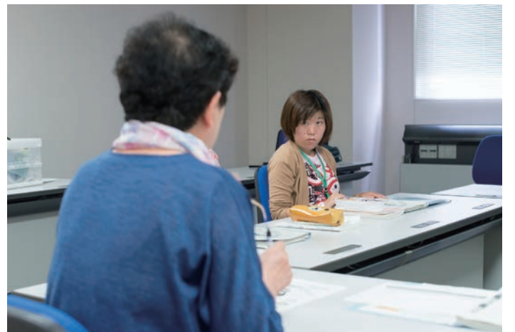
午後はヘルパーの資格をとるために勉強