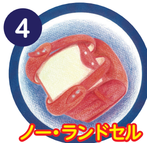
ノー・ランドセル