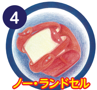
ノー・ランドセル